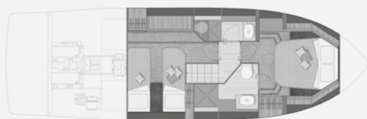
LOWER DECK - TWO CABINS