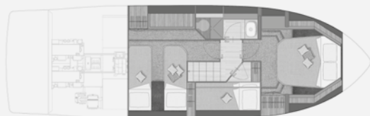
LOWER DECK - THREE CABINS