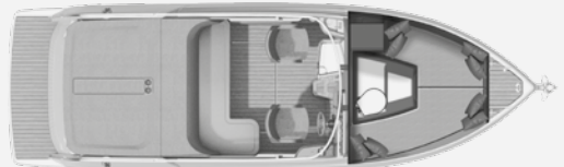
LOWER DECK DAY